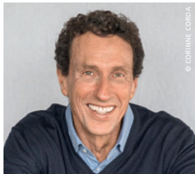
Prof. Dr. Julian Nida-Rümelin