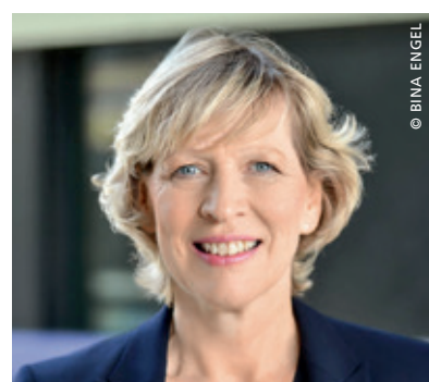
Senatorin Dorothee Stapelfeldt