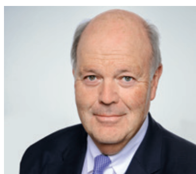
Minister Hans-Joachim Grote