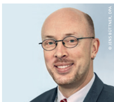
Minister Christian Pegel