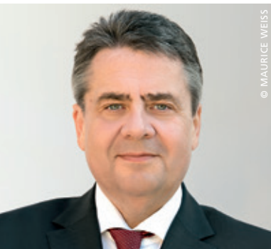
Sigmar Gabriel, Bundesminister a.D.